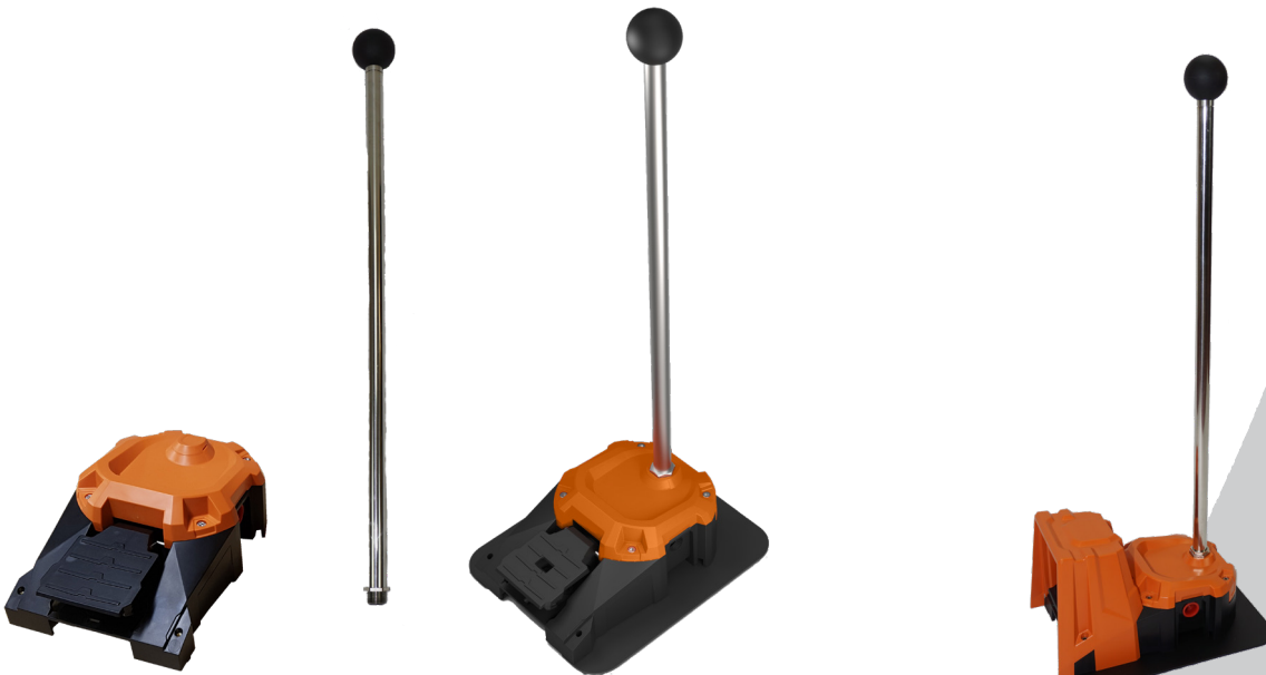
mit 6050-5500-0154 Grundplatte (Bestellangaben siehe "Zubehör")